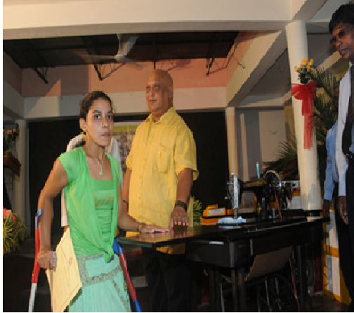
පුහුණු ආයතනවල පුහුණුව

මේ යටතේ සිදුව, කැටවල, වත්තේගම යන ස්ථානවල පවත්වාගෙන යනු ලබන ආබාධ සහිත වුවන් සඳහා වූ වෘත්තීය