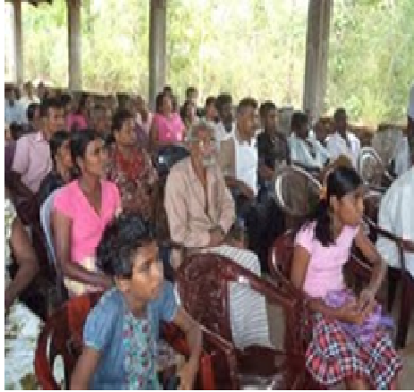
කෙරිණ. මෙම වැඩසටහනට බකමුණ

උපදේශන සහ මනෝසමාජ මැදිහත්වීම් වැඩසටහනක් 2012 ජූලි 8, 9 සහ 10 දිනයන් දී බකමුණ ප්‍රාදේශීය ලේකම් කොට්ඨාශයේ ඇලහැර ප්‍රදේශයේ දමනයාය, නුවරගල යන ගම්මානයන්හි පැවැත්විණ. මේ සඳහා ජාතික උපදේශන මධ්‍යස්ථානයේ උපදේශකයන් දස දෙනෙක් සහභාගී වූ අතර ප්‍රදේශයේ සෑම පවුලක්ම සම්මුඛ පරීක්ෂණයට ලක් කිරීම තුළින් ඔවුන්ගේ මනෝ සමාජීය ගැටළු හඳුනා ගැනීමට උත්සාහ